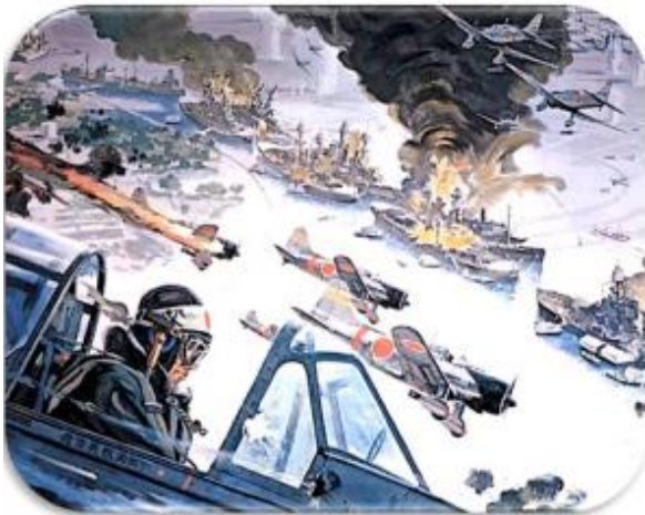
L'attaque japonaise sur Pearl Harbor.

Le Japon (allié de l'Allemagne) provoque l'entrée en guerre des Etats-Unis dirigés par le président Roosevelt en attaquant et en détruisant, par surprise, la flotte américaine du Pacifique à Pearl Harbor .