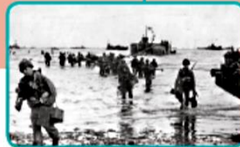
▲ Soldats britanniques sur la plage d'Utah le 6 juin 1944.