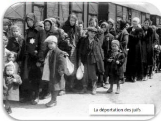
La déportation des juifs

Les juifs ne sont pas seulement touchés par les difficultés de la guerre. Ils sont aussi victimes de la politique antisémite mise en place par le gouvernement de Pétain : statut des juifs, port de l' étoile jaune , arrestations, déportations vers les camps d'extermination .