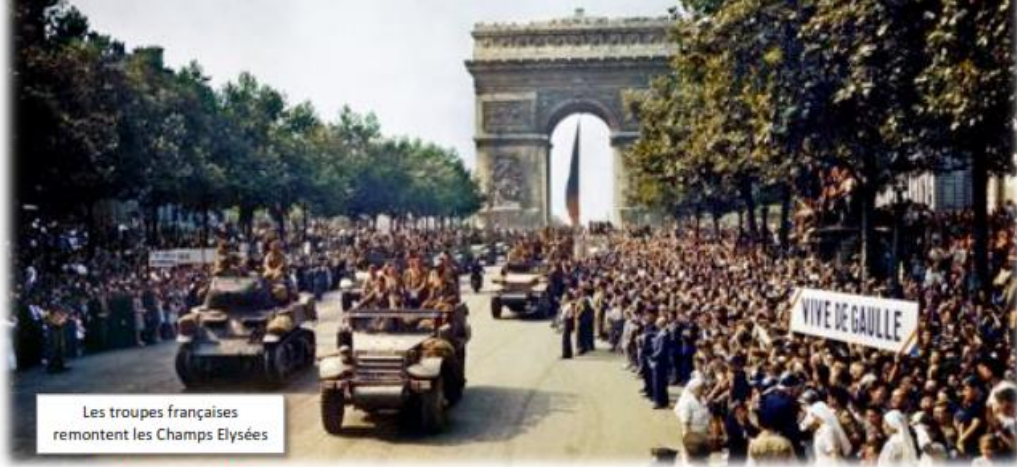
Les troupes françaises remontent les Champs Elysées

La libération de Paris a eu lieu en août 1944 , marquant ainsi la fin de la bataille de Normandie. Cet épisode met fin à quatre années d'occupation de la capitale française.