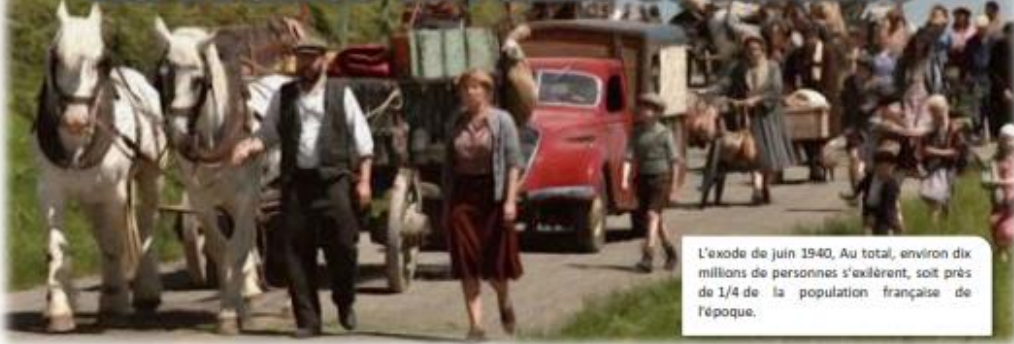
L'exode de juin 1940. Au total, environ dix millions de personnes s'exilèrent, soit près de 1/4 de la population française de l'époque.