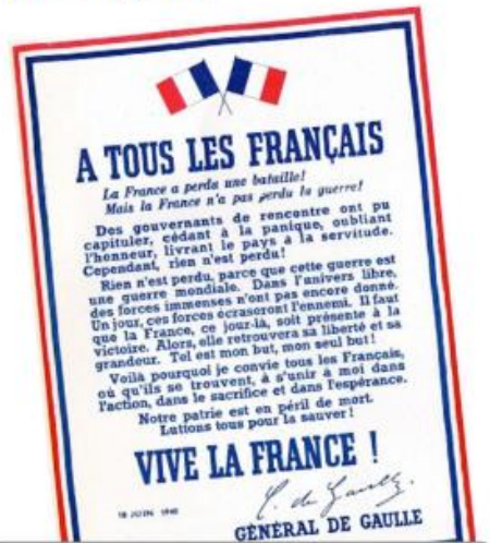
Appel du 18 juin 1940 : l'appel à la résistance du général de Gaulle

A Londres, des unités combattantes étaient constituées pour poursuivre la lutte aux côtés de l'Angleterre. En France, des groupes de maquisards s'organisaient dans les bois et dans les montagnes. Par tous les moyens, ils continuaient de lutter : coupant les voies, faisant sauter les ponts, tendant des embuscades aux soldats isolés. La répression fut terrible. Les Résistants furent fusillés ou déportés dans des camps de concentration (Buchenwald ..). Plus de 100 000 y moururent de faim, de froid, ou à la suite d'affreuses tortures.