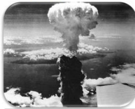
Les 6 et 9 août 1945 les bombardements sur Hiroshima et Nagasaki font plus de 200 000 morts

combattants de 61 nations , déployant les hostilités sur quelque 22 millions de km 2 , et tuant environ 62 millions de personnes, dont une majorité de civils .