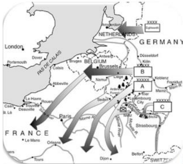
La bataille de France ou la guerre éclair

Le 10 mai 1940, brusquement, Hitler attaque la France par la Hollande et la Belgique . Une armée française qui s'était portée à la rencontre des Allemands recula, harcelée par des centaines d'avions et de chars. Une partie fut encerclée; 300 000 Anglais et Français réussirent à s'embarquer à Dunkerque malheureusement presque tout le matériel fut abandonné.