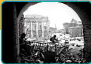
▲ Soldats soviétiques combattant dans Stalingrad, décembre 1942.