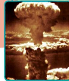
▲ Le champignon atomique sur Nagasaki.