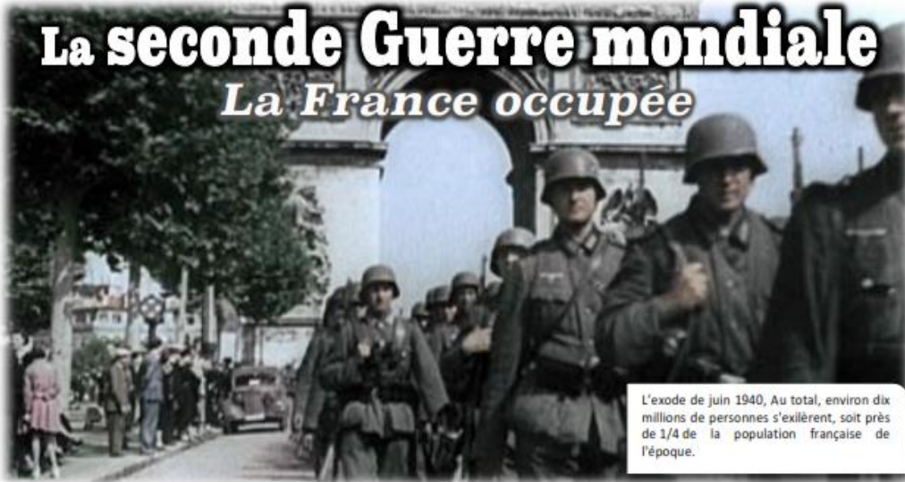
L'exode de juin 1940, Au total, environ dix millions de personnes s'exillèrent, soit près de 1/4 de la population française de l'époque.

• L'armistice, 25 juin 1940. De Bordeaux où il s'était retiré, le gouvernement du Maréchal Pétain demanda un armistice: Les conditions en furent très dures : la moitié de la France deux millions de prisonniers, lourde indemnité de guerre à payer au vainqueur.