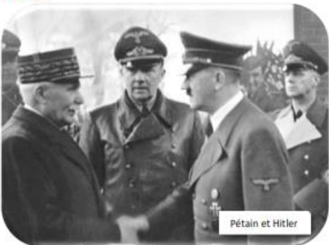
Pétain et Hitler

La défaite entraîna la chute de la République. Pétain prit le titre de chef de l'Etat français et s'installa à Vichy .