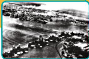
▲ L'attaque de Pearl Harbor par les Japonais.