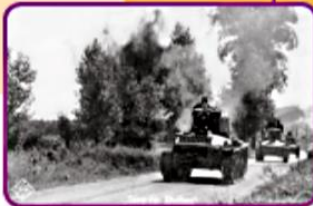
▲ Colonne de chars allemands en mai 1940.