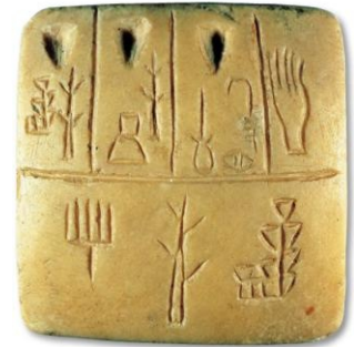
Tablette en pierre calcaire, découverte en Mésopotamie

Au départ, les hommes écrivait avec des ..... Chaque mot était représenté par un signe. Pour écrire, il fallait donc en connaître des milliers !